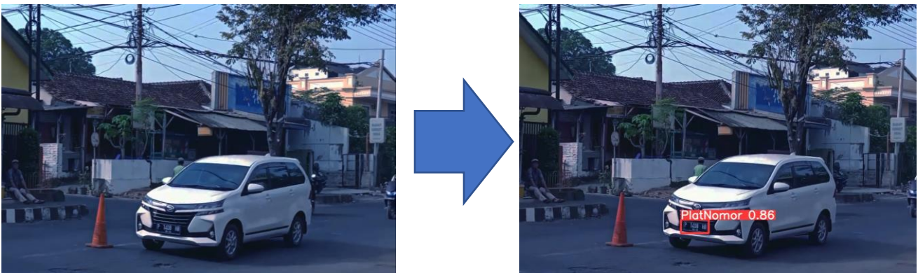
Gambar 3. Bounding box dan Confidence Score Deteksi Objek YOLO

Dari dataset yang akan diujikan di input ke dalam sistem, kemudian dilakukan proses deteksi objek menggunakan YOLO v8 menggunakan model YOLO yang sudah pre-train sebelumnya. Pre-train model ini telah mempelajari fitur-fitur visual yang relevan untuk membedakan objek termasuk plat nomor kendaraan. Model tersebut akan memproses gambar dan melakukan prediksi keberadaan objek plat nomor. Output dari prediksi keberadaan objek ini akan ditandai berupa bounding box disertai confidence score yang mengidentifikasi lokasi keberadaan gambar. Hasil bounding box atau penanda berupa area persegi untuk objek yang berhasil dideteksi, sedangkan confidence score pada umumnya terletak didekat bounding box yang menunjukkan tingkat keyakinan model terhadap deteksi tersebut. Yang kemudian dilakukan cropping atau pemotongan objek, yang berguna untuk memisahkan objek hasil deteksi dengan objek lainnya. Dapat dilihat pada gambar 3