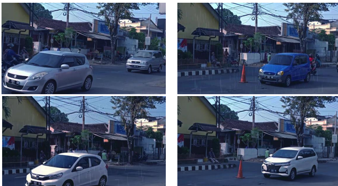
Gambar 2. Dataset Kendaraan dengan Plat Nomor

Sebagian gambar dalam kondisi buram, kurang pencahayaan, atau miring. Resolusi gambar beragam, dengan beberapa gambar berukuran kecil. Gambar diambil di lingkungan outdoor dengan pencahayaan alami. Dataset yang digunakan untuk pengujian sebanyak 10 gambar plat nomor kendaraan. Serta memiliki noise akibat pencahayaan rendah atau refleksi. Beberapa gambar diambil miring atau tidak sejajar. Dataset ini mencerminkan kondisi nyata dalam pengambilan gambar plat nomor kendaraan, sehingga relevan untuk menguji robustness dari sistem OCR dapat dilihat pada gambar 2.