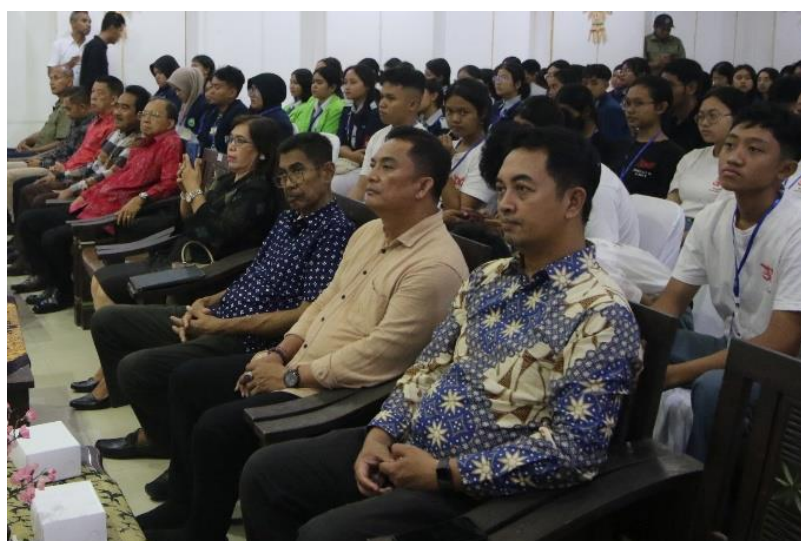
Gambar 4. Tim Kolaborasi dalam Pendampingan

Kolaborasi tersebut memberikan motivasi eksternal yang sangat besar bagi para siswa. Kehadiran narasumber dari praktisi media profesional membuat siswa merasa bahwa apa yang mereka pelajari memiliki relevansi langsung dengan standar industri media saat ini. Mereka tidak lagi melihat penulisan sebagai tugas sekolah semata, melainkan sebagai alat untuk berekspresi secara terhormat di ruang publik. Kegiatan sosialisasi yang dilaksanakan hingga menuju kompetisi jurnalistik pelajar tahun 2026 menjadi titik balik penting dalam proses pembelajaran ini, karena memberikan target nyata bagi siswa untuk menguji sejauh mana kemampuan mereka.