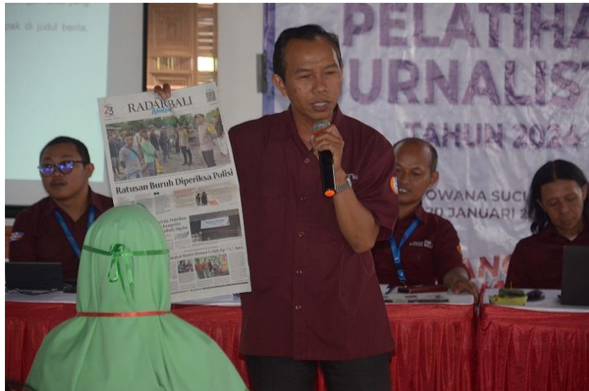
Gambar 5. Sosialisasi dan Pendampingan

Dalam setiap sesinya, narasumber dari pendampingan tidak hanya mengenalkan teknik-teknik teknis penulisan opini seperti teknik Thesis, Argument, and Reiteration. Mereka juga memberikan perspektif mengenai pentingnya menjaga integritas seorang penulis dalam menyikapi sebuah isu yang sedang viral. Batasan etika dalam bermedia sosial ditegaskan kembali sebagai pagar pengaman bagi para siswa agar mereka tidak terjebak dalam kasus hukum seperti pencemaran nama baik atau penyebaran berita bohong. Siswa diajak memahami bahwa meskipun media sosial memberikan ruang berekspresi yang luas, tanggung jawab moral tetap melekat pada setiap individu yang bersuara.