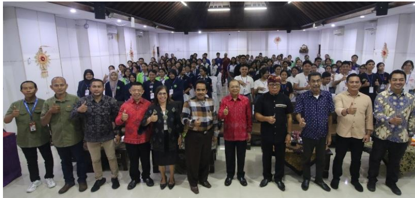
Gambar 3. Peserta Pendampingan Penulisan Opini Kritis dan Etika Berkomunikasi di Media Sosial

Pendampingan penulisan opini kritis dan etika berkomunikasi di sosial media dikonsept sebagai sebuah proses pembelajaran kontinu yang sangat dinamis. Tujuannya adalah menciptakan sinkronisasi antara teori jurnalistik yang bersifat baku dengan praktik komunikasi digital yang dilakukan siswa dalam aktivitas sehari-hari di internet. Dimensi praktis dalam program ini menjadi semakin nyata dengan adanya kolaborasi strategis bersama Jawa Pos Radar Bali. Kemitraan dengan media arus utama ini memberikan wawasan kepada siswa tentang bagaimana sebuah opini dapat memiliki dampak luas dan pengaruh sosial jika dikelola dengan standar jurnalistik yang profesional.