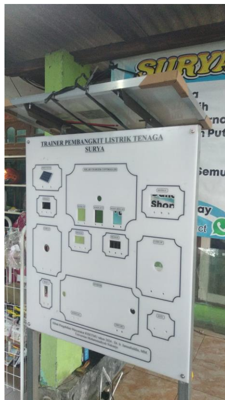
Gambar 2. Tampilan panel Trainer Smart PLTS setelah proses pemasangan komponen dan modul PV.

Kekuatan utama trainer ini terletak pada sifatnya yang modular dan visual. Setiap komponen ditempatkan pada papan trainer sehingga mudah dikenali, ditelusuri, dan dijelaskan oleh guru. Dengan adanya titik ukur, terminal koneksi, dan jalur pengawatan yang tampak, siswa dapat mempelajari PLTS sebagai sistem yang memiliki alur energi, bukan sebagai kumpulan komponen terpisah. Hal ini membuat trainer dapat digunakan untuk pembelajaran identifikasi komponen, pengukuran output PV, pengisian baterai, konversi DC-AC, penggunaan beban, serta diskusi mengenai keselamatan rangkaian listrik.