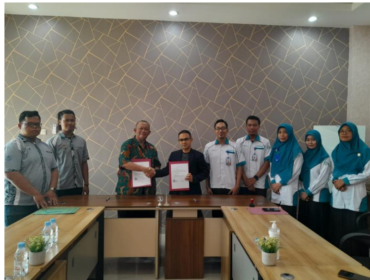
Gambar 4. Serah terima Trainer Smart PLTS kepada SMK Muhammadiyah 3 Ngoro.