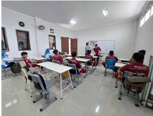
Gambar 3. Pelatihan pengoperasian Trainer Smart PLTS kepada pihak sekolah.