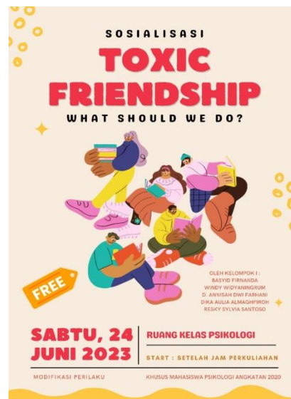
Gambar 1. Flyer Sosialisasi Toxic Friendship ; What Should We Do?