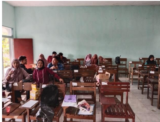
Gambar 3 dan 4. Pelaksanaan Sosialisasi