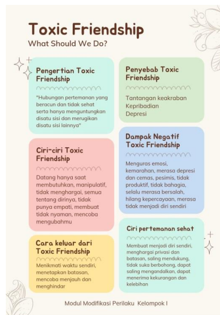
Gambar 2. Modul Toxic Friendship ; What Should We Do?