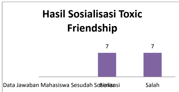
Gambar 6. Hasil data jawaban mahasiswa sesudah pelaksanaan sosialisasi