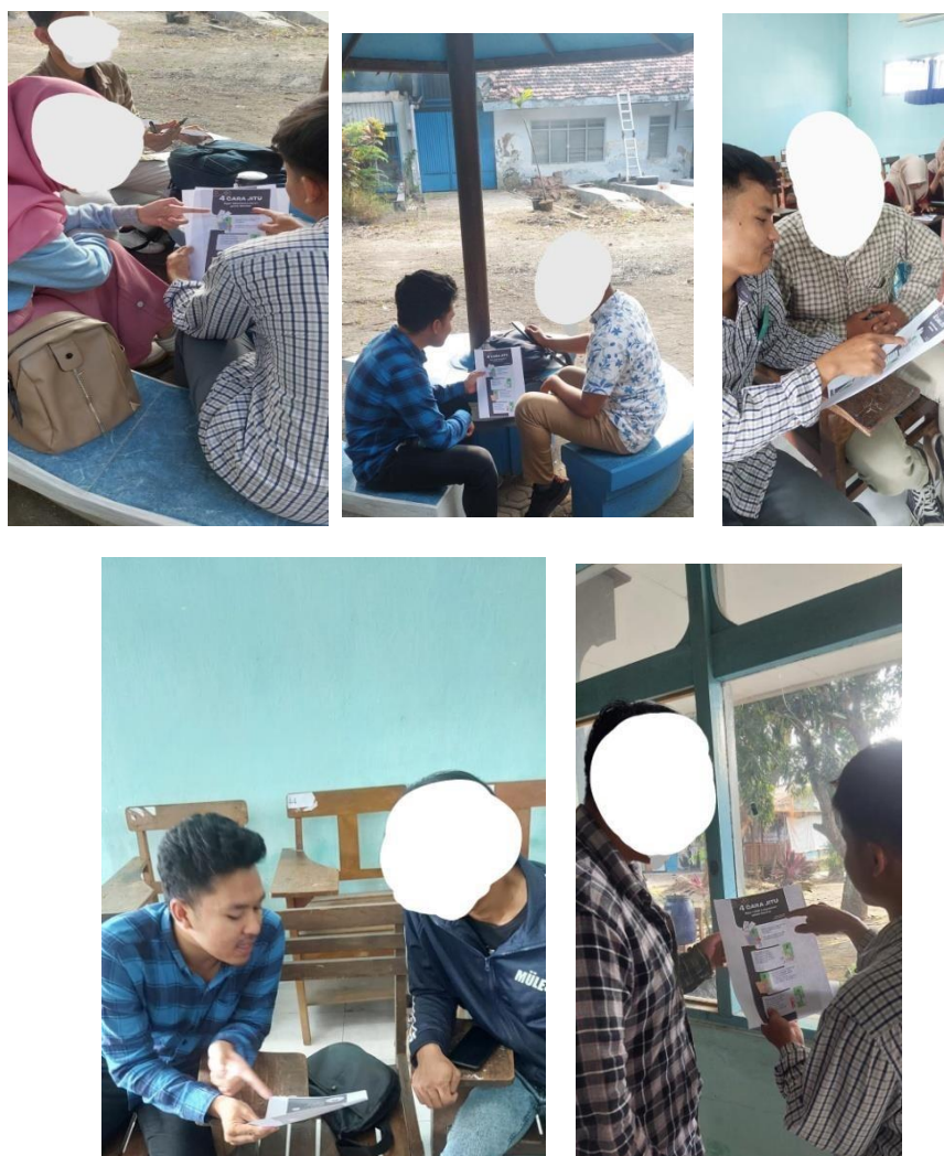
Gambar 3. Sebaran Poster kepada mahasiswa

Penyebaran poster kepada mahasiswa dilingkungan Universitas Darul ‘Ulum dilakukan selama 3 hari dari tanggal 21 Juni hingga 23 Juni 2023.