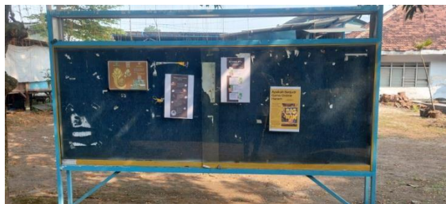
Gambar 2. Penempelan Poster di Mading

Penyebaran poster dilingkungan Universitas Darul ‘Ulum dilakukan pada tanggal 20 Juni 2023, poster disebar dengan cara ditempelkan di mading Fakultas, mading Masjid, Sekertariat BEM, dan di tempat yang kemungkinan sering di lewati mahasiswa.