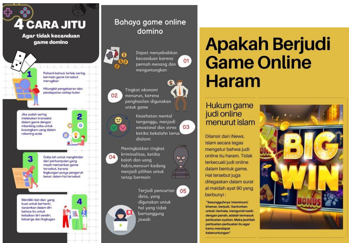
Gambar 1. Poster Modifikasi Prilaku (Teknik Shaping)

Pelaksanaan Modifikasi Prilaku Teknik Shaping dilakukan dengan menyebarkan poster ke berbagai tempat yang sering dilewati oleh mahasiswa di lingkungan Universitas Darul'Ulum, tempat yang ditemplei poster berupa papan madding kelas, papan mading di masjid, papan mading di kantor sekretariat BEM, dan di papan mading dimana mahasiswa sering nongkrong dikampus, selain itu poster juga di sebarakan kepada mahasiswa yang kemudian modifikator menjelaskan isi dari poster tersebut, setelah modifikator menjelaskan tentang isi dari poster responden diminta untuk mengisi google form yang telah disediakan. Pertanyaan survei berupa identitas responden, status sebagai mahasiswa yang bekerja atau tidak, intensitas bermain game, tanggapan mengenai poster, dan insight yang di dapat setelah melihat poster, apakah poster bermanfaat, apakah poster memotivasi responden, dan apakah responden akan menerapkan isi dari poster yang sudah dilihatnya.