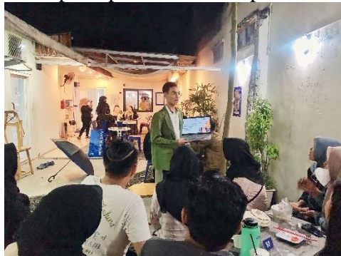
Gambar 1. Kegiatan Pemaparan Materi Pentingnya Personal Branding

Peserta-peserta dari Karang Taruna Dusun Babatan Dua dengan semangat tinggi ikut serta dalam kegiatan pengabdian masyarakat. Kegiatan pengabdian masyarakat ini bertujuan untuk meningkatkan kesadaran pentingnya personal branding dalam media sosial Instagram dan pembuatan konten melalui alat bantu Canva yang dimiliki oleh pemuda Karang Taruna Dusun Babatan Dua. Para pemuda didorong untuk memahami cara memanfaatkan media sosial sebagai sarana untuk membangun personal branding dan pemanfaatan alat bantu editing konten yang diharapkan dapat meningkatkan daya tarik dan kreativitas personal branding . Dokumentasi pada saat pemaparan materi dapat dilihat pada gambar 1.