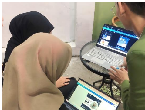
Gambar 2. Kegiatan Praktik Langsung Pembuatan Konten Melalui Canva

Sesuai dengan penelitian terdahulu, Canva telah menjadi salah satu cara yang populer dalam menghasilkan konten dan desain berbasis Teknologi Informasi dan Komunikasi (TIK). (Alhasbi et al., 2022) memanfaatkan Canva sebagai pembuatan konten untuk membentuk sebuah identitas, (Santoni et al., 2023) memanfaatkan Canva sebagai pembuatan konten promosi, (Sholeh et al., 2020) memanfaatkan Canva sebagai pembuatan konten gambar pada media sosial. Maka, pemateri mengajak para peserta kegiatan pengabdian masyarakat untuk praktik langsung dalam membuat sebuah konten dengan menggunakan alat bantu desain yaitu Canva. Dokumentasi pada saat praktik pembuatan konten dengan menggunakan Canva dapat dilihat pada gambar 2.