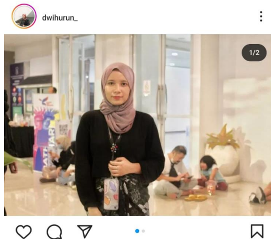
Gambar 3. Hasil Desain Konten Sebelum Mengikuti Kegiatan Pengabdian Masyarakat

sehingga mayoritas dari mereka menggunakan Canva baik melalui laptop maupun smartphone untuk membuat desain. Dengan demikian, setiap peserta dapat tetap aktif dalam praktik pembuatan desain. Para peserta menunjukkan antusiasme yang tinggi dalam pelatihan ini, terlihat dari keterlibatan mereka dalam bertanya dan meminta umpan balik terhadap pekerjaan mereka. Selama pelatihan, peserta berhasil menghasilkan karya yang siap dipublikasikan ke media sosial mereka. Hasil desain konten sebelum dan sesudah, setelah peserta mengikuti kegiatan pengabdian masyarakat dapat dilihat pada gambar 3 dan 4.