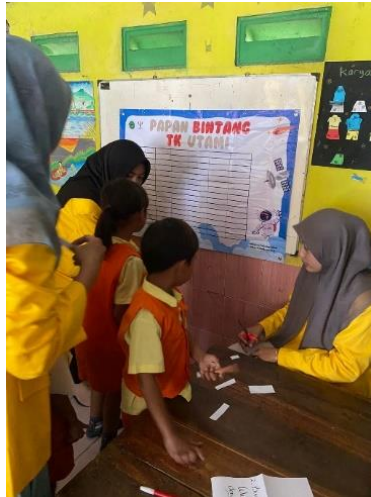
Gambar 1. Pemasangan Papan Bintang

Pemasangan papan bintang di kelas B TK Utami Ceweng pada tanggal 4 Juni 2024, dengan cara papan bintang ditempel di papan kelas B karena merupakan lokasi yang dapat dilihat anak dengan mudah dan mamiliki pencahayaan yang baik.