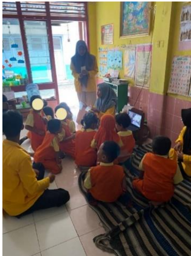
Gambar 3. Kegiatan menyampaikan keinginan