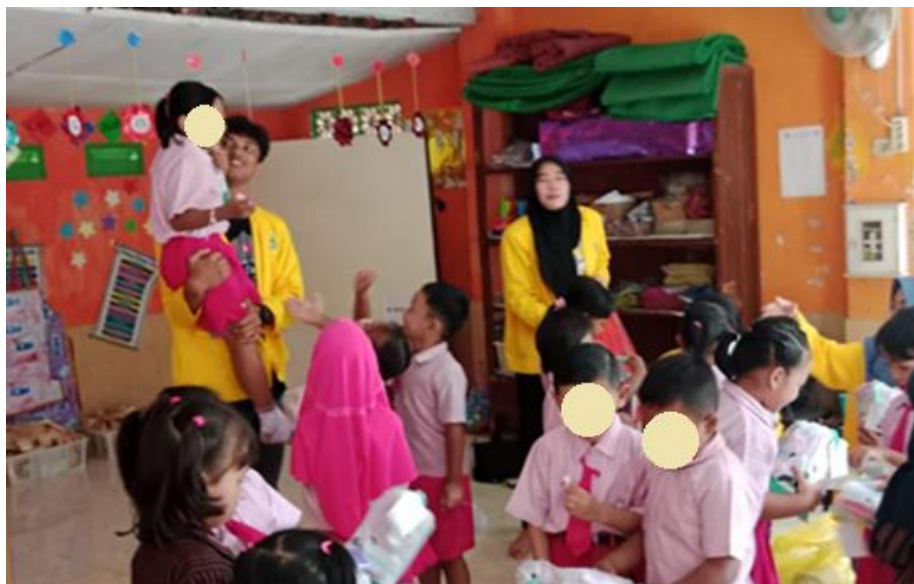
Gambar4. Kegiatan memberekan mainan setelah digunakan