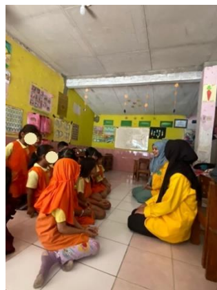
Gambar 2. Kegiatan menyampaikan pendapat

Kegiatan bermain sesuai tema dilakukan untuk meningkatkan kemandirian anak, memberikan kesempatan berpendapat sesuai bahasanya. Memberikan kesempatan anak-anak menyelesaikan tantangannya sendiri sebagai bentuk sikap tanggung jawab.