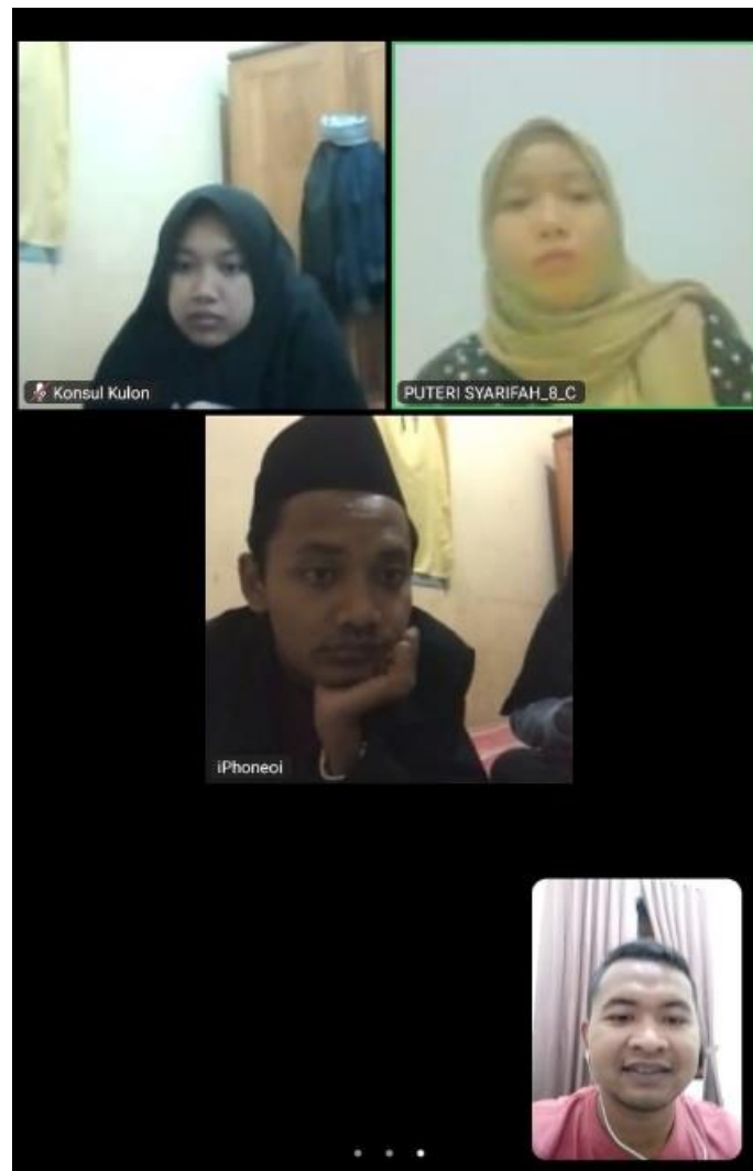
Gambar 1 Pendampingan dan Pelatihan Digital Marketing dan E-Commerce

Pelatihan diadakan secara online melalui platform Zoom dengan bantuan pendamping dari beberapa UMKM di Desa Carangwulung. Ada satu pertemuan tatap muka dalam pelatihan ini, dan modelnya adalah 20–40–40. Pada paruh waktu pelatihan ini, instruktur memberikan instruksi tentang pembuatan digital marketing, simulasi secara langsung, dan tugas yang harus diselesaikan oleh peserta dalam waktu tertentu.