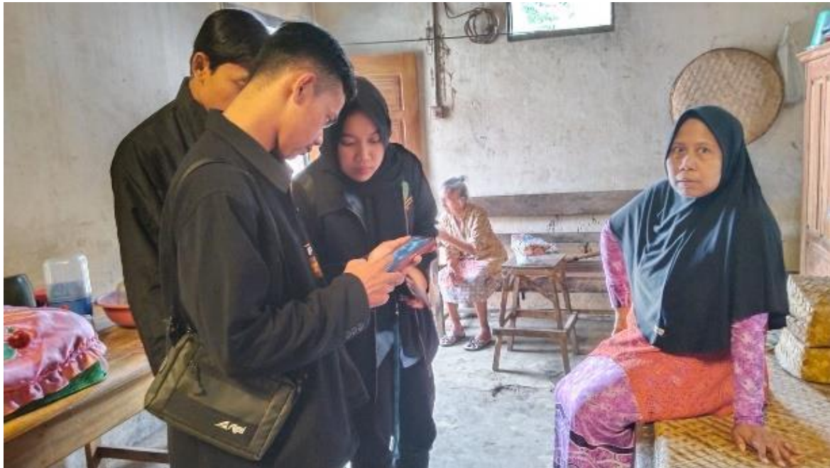
Gambar 2 Monitoring Pelatihan dan Pendampingan Digital Marketing