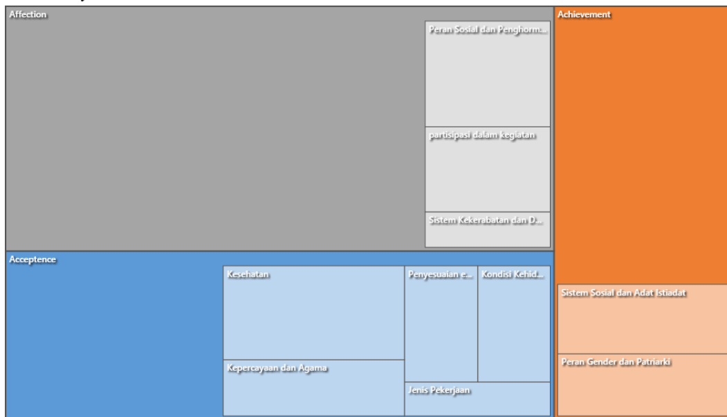
Gambar 1.7 Hierarchy Chart

Berikut adalah hasil dari ketiga subjek yang disimpulkan menggunakan gambar yaitu Hierarchy Chart .