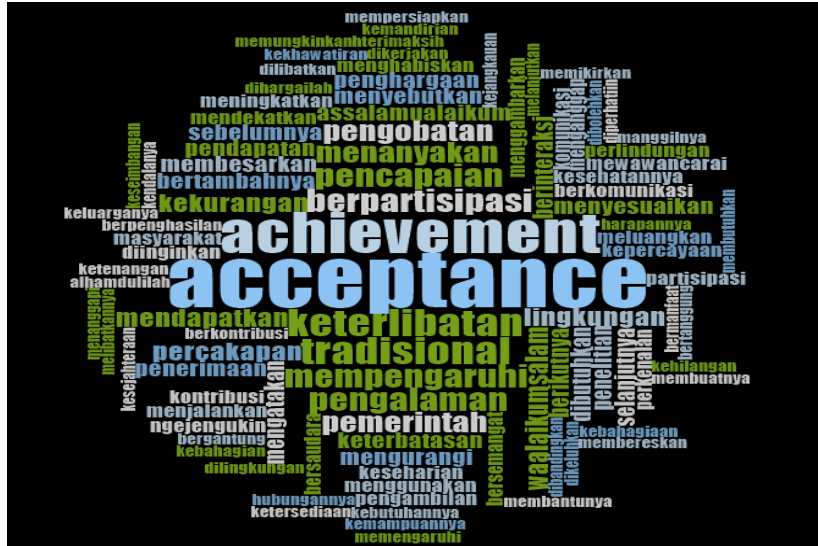
Gambar 1.1 Word Frequency Query subjek H

Hasil analisis Word Cloud dengan NVivo 12 menunjukkan kata utama acceptance dan achievement , mencerminkan penerimaan hidup, rasa syukur, serta kepuasan atas pencapaian pribadi. Kata keterlibatan dan tradisional menyoroti partisipasi sosial, adat, dan peran budaya lansia.