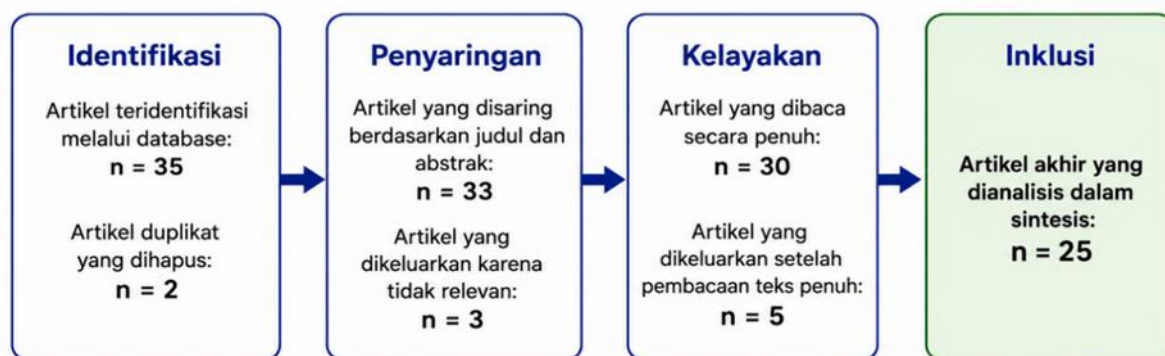
Gambar 2. Diagram Alur Seleksi Literatur PRISMA

Unit analisis dalam studi ini adalah isi konseptual dan empiris dari setiap artikel yang dipilih. Data diekstraksi menggunakan matriks yang berisi pengenalan bibliografi, tujuan studi, konteks regional, pendekatan teoretis, metode, temuan utama, relevansi dengan tema tanah-alam-penciptaan, serta kontribusi terhadap sintesis ekoteologi Papua. Analisis dilakukan menggunakan sintesis naratif-tematik karena literatur yang ditinjau bersifat heterogen dalam hal disiplin ilmu, materi subjek, dan metode. Proses pengkodean dilakukan secara manual menggunakan pendekatan deduktif-induktif: pengkodean deduktif dimulai dari kerangka awal seperti deforestasi, perluasan kelapa sawit, tanah sebagai ibu, krisis relasional, alam sebagai ciptaan, dan teologi ekologi kontekstual, sedangkan pengkodean induktif digunakan untuk menangkap tema-tema baru dari literatur. Analisis dilakukan